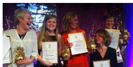
Vinnare av Guldugglorna 2017!