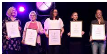
Vinnare av Guldugglorna 2018!